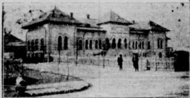
O Școală primară